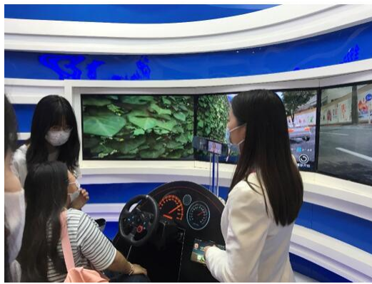
行车 SOS 安全智能服务仿真体验