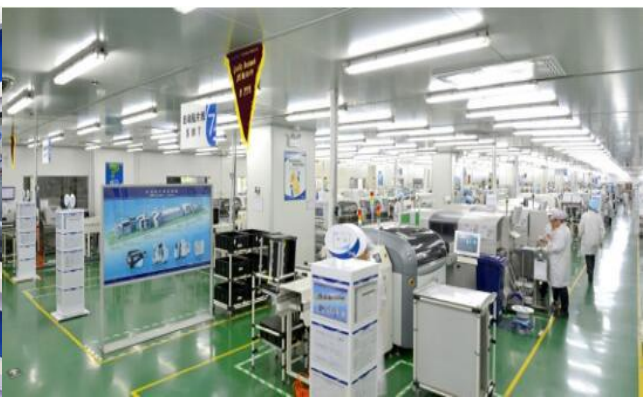
柔性智能制造基地