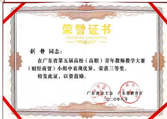
部分优秀教师荣誉