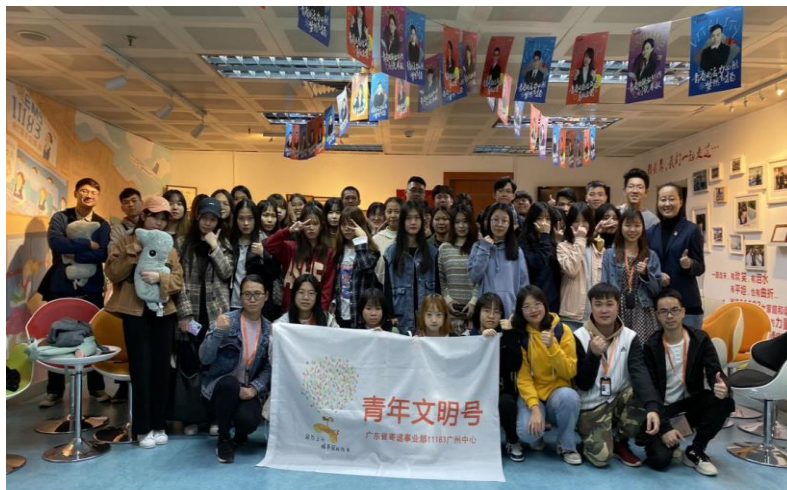
学生企业实习合照

社会服务过程中，学生通过校内集训、企业培训、师带徒观摩与指导、独立上岗等几个环节完成项目任务。项目实施过程采取小组形式，小组间分组竞抗，与企业员工共同参与考核、参与活动，并将实习业绩作为课程考核成绩。咸以躬行实践为先，社会服务项目不仅开阔了学生的视野、丰富了学生的课外知识，也让学生在真实的岗位中增强了职业体验、积累了工作经验和岗位实操技能，通过“专业性”“精准性”的社会服务，将企业与对口专业配对，实行校企“双主体”的专业人才培养模式，实现人才培养和就业的一体化，真正实现高职院校为社会培养行业、企业需求的高素质技术技能人才的目标。