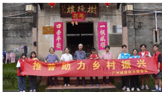
学生暑期三下乡社会实践