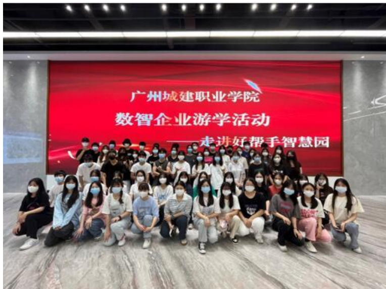
数智企业游学体验活动