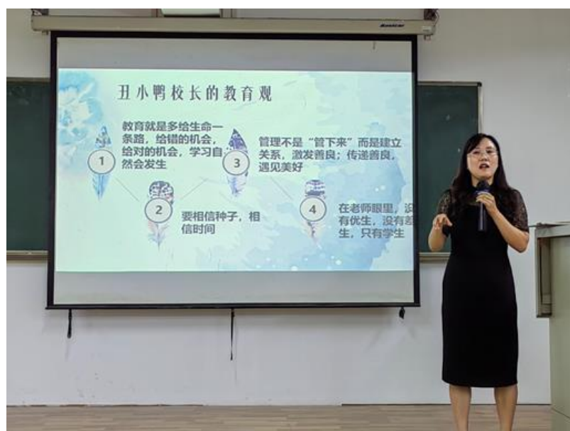
师德师风专题教育之《丑小鸭校长的教育观》

教师主动参与疫情防控工作，发挥党员先锋模范作用，组织学习十九届六中全会精神、二十大会议精神等思想政治教育活动；观影优秀党员同志先进事迹、观看《师德启思录》、《榜样》等专题节目累计 15 次；由书记、院长及优秀教师组成的讲师团，开展《丑小鸭校长的教育观》《中国十位优秀教师》等专题讲座 5 次；每月开展一次“院长约你喝咖啡”，一月一次师德警示教育。