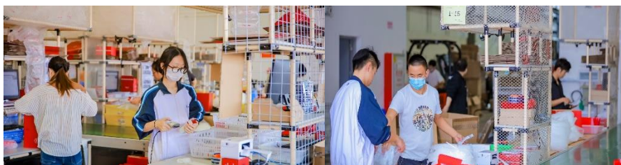
企业定制课程 - - B2C 订单分拣