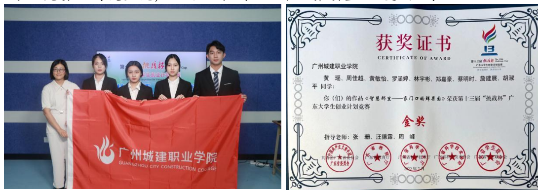
表 2-2 标志性成果统计表

项目团队日以继夜地对项目进行打磨、完善，无数遍进行项目路演模拟，最终在决赛终审答辩环节交出最完美的答卷，这反映出学院领导及全体师生对“挑战杯”竞赛的高度重视，也体现了我院人才培养质量的稳步提高。