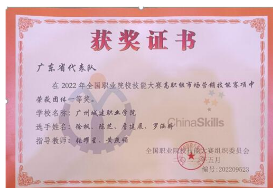
市场营销技能赛项国赛一等奖

经济与管理学院充分利用校院两级竞赛激励机制，构建经管学院独特的竞赛生态系统。通过组建竞赛指导教师团队，广泛开展校内选拔赛，遴选具有培养潜质的学生作为参赛种子选手，通过不断的训练和考核，最终选拔出最优团队。注重学生参赛团队梯队建设，通过“以老带新、传帮带”的方式，引导参赛师生团队深入研究竞赛规程、技术规范，反复打磨、精益求精。自 2020 年起，学生参加市场营销技能赛项连续三年省赛一等奖，2021 年进入国赛遴选，2022 年国赛排名第二斩获一等奖，是学校建校以来最好成绩。学生参加 2022 年金砖国家职业技能大赛区域选拔赛网络营销赛项获二、三等奖各一项；另有 4 个赛项获得 2022 年一带一路暨金砖国家技能发展与技术创新大赛国内总决赛二、三等奖各两项。第十三届“挑战杯”广东大学生创业计划竞赛金奖，第八届中国国际“互联网+”大学生创新创业大赛国赛铜奖。