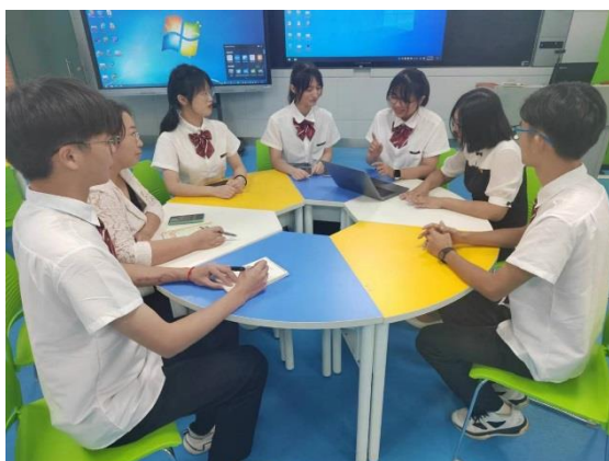
创业团队交流研讨