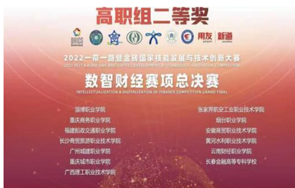
数智财经赛项总决赛二等奖