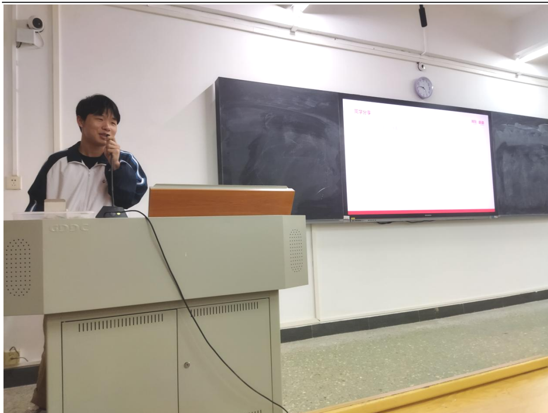
企业高管/学生分享