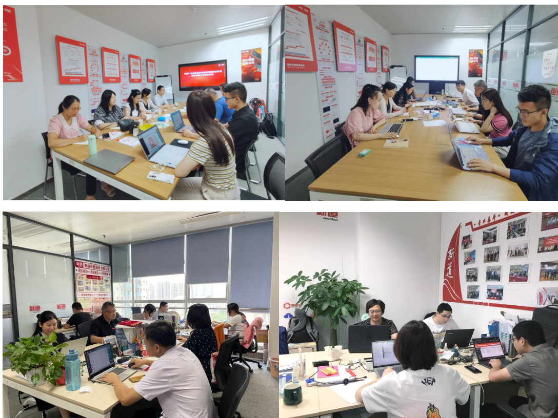
专任教师企业实践

同时为了提升产业学院校企师资融合合作，新道老师与学院部分骨干老师组建了产业学院师资建设团队，就产业学院专业建设、课程内容等方面进行不定期交流。同时，学院骨干老师被聘任为新道认证名师，后续可提供社会服务承接新道科技对外的师资培训或课程授课。学院专任老师和新道顾问老师们将继续深入交流和合作，以不断提升产业学院共建专业（群）教师教学水平和科研水平。