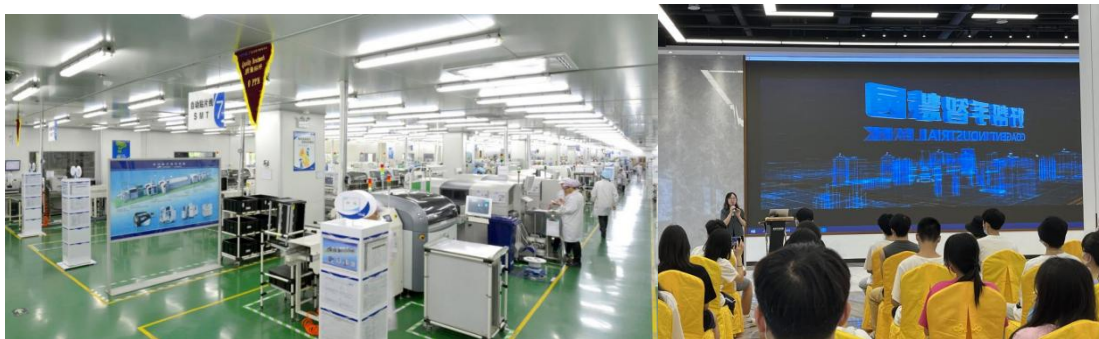
企业实地参观学习