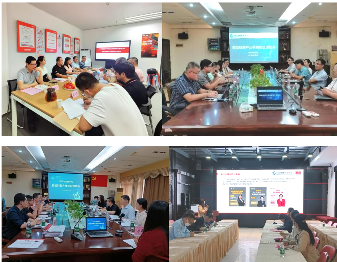
产业学院理事会交流