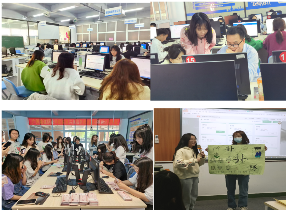
企业老师授课场景