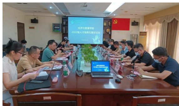
人才培养交流及人培方案制定